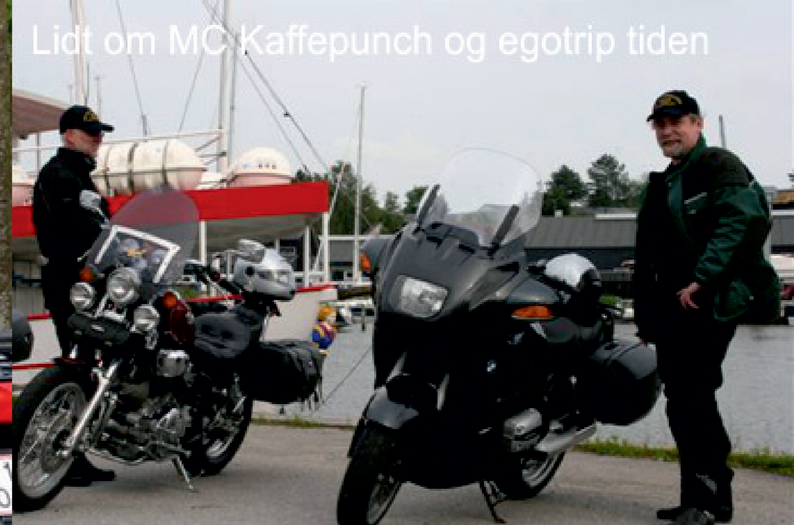
Lidt om MC Kaffepunch og egotrip tiden